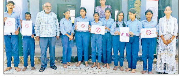
नारनौल। कार्यक्रम में भाग लेते स्कूल के विद्यार्थी।