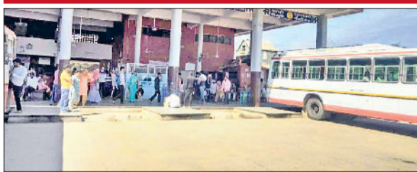
नारनौल। महेन्द्रगढ़ बस स्टैंड।