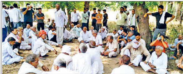
महेन्द्रगढ़। नागरिक अस्पताल में मौजूद ग्रामीण।