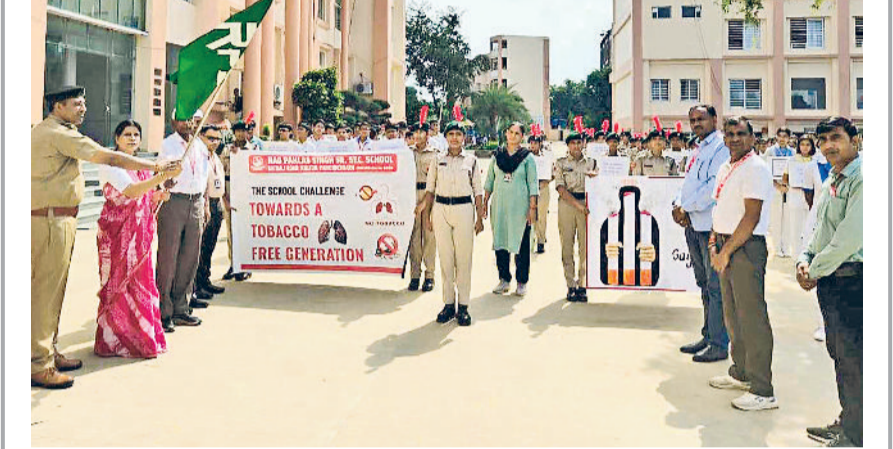
महेन्द्रगढ़। कार्यक्रम में प्रस्तुति देते विद्यार्थी।