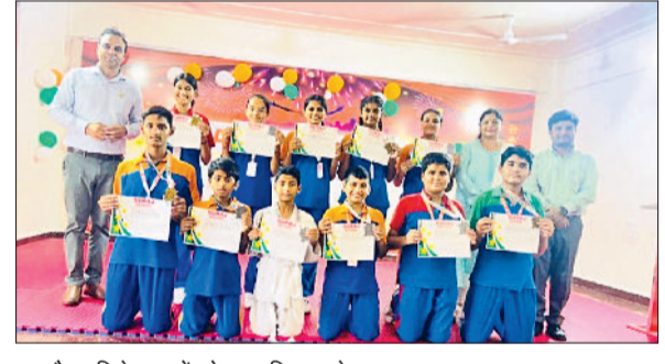
नारनौल। विजेता बच्चों को सम्मानित करते हुए।