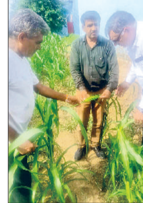
नारनौल। खड़ी फसल का मौके पर जाकर सर्वे करते हुए।

जिले में राजस्व विभाग, कृषि विभाग तथा उपग्रहों के जरिए खरीफ फसल की गिरदावरी का कार्य जोरों पर है। इस कार्य से किसानों का खेत अनुसार फसल का विवरण तैयार किया जाएगा, जिसे मेरी फसल मेरा ब्योरा पोर्टल पर अपलोड किया जाएगा, जिसका फायदा किसानों को मिल सकेगा। यह कार्य गत पांच अगस्त से शुरू किया गया था, जो पांच सितंबर तक निरंतर एक माह चलेगा। गौरतलब हो कि सरकार हर साल फसलों की गिरदावरी करवाती है। चाहे रबी सीजन हो या खरीफ। दोनों बार ही संबंधित विभागों के अधिकारी एवं कर्मचारी मिलकर यह कार्य करते हैं। इस बार यह कार्य डिस्ट्रिक्ट रेवेन्यू ऑफिस यानि डीआरओ के पटवारी कर रहे हैं। डीआरओ के अधीन पटवारी खेतों में जाने से