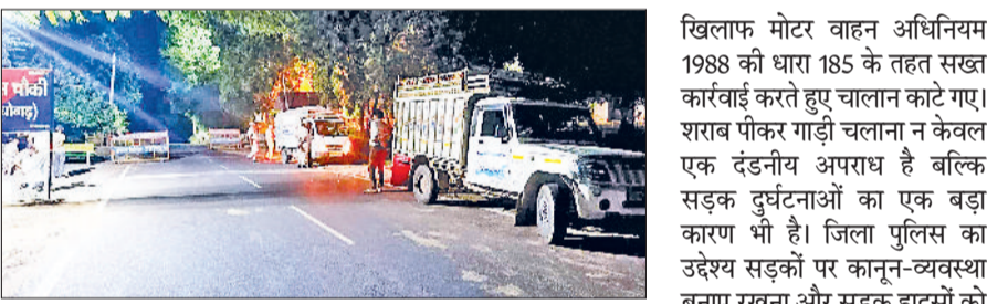
नारनौल। वाहनों की जांच पड़ताल करती पुलिस टीम।