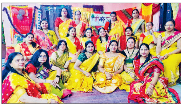
नारनौल। कार्यक्रम में भाग लेती महिलाएं।