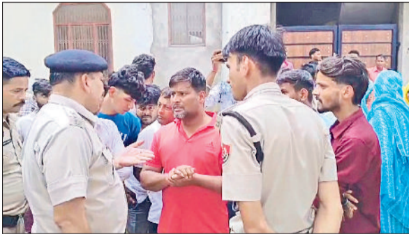
नारनौल। पुलिस से बातचीत करते मोहल्ले के लोग।

शहर के मोहल्ला मियां की सराय में शुक्रवार उर्स कार्यक्रम को लेकर तनाव हो गया। दरअसल, मोहल्ले व वार्ड पार्श्वद ने तनाव को देखते हुए उर्स कार्यक्रम नहीं करने के लिए प्रशासन को लिखा। आरोप है कि इसके बावजूद वहां दूसरे समाज के लोग आ गए। इसके बाद कुछ समय के लिए भारी पुलिस दल के बीच गहमागहमी का माहौल बना रहा। आपसी सहमति बनने के बाद ही उर्स कार्यक्रम आयोजित किया गया। जानकारी